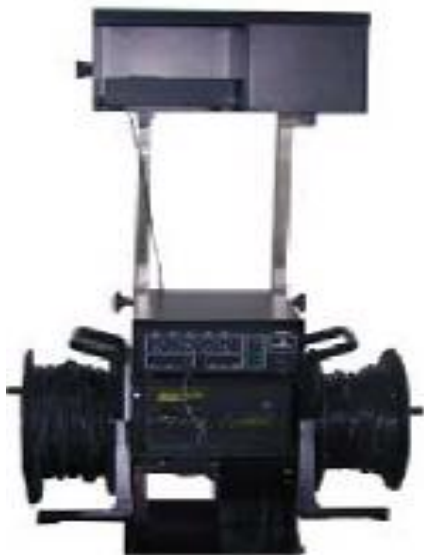
Тележка с укрепленным оборудованием

Система фальстарта для легкой атлетики SJC используется на коротких дистанциях (до 400 м). Система состоит из тележки с укрепленным на ней оборудованием и стартовых блоков (на каждой беговой дорожке). В системе имеется встроенная звуковая система, позволяющая старту давать команды атлетам (встроенные в стартовые блоки громкоговорители), таким образом все атлеты слышат команду одновременно, без задержек.